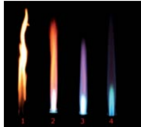
Figura 2. Tipos de llama en un mechero Bunsen dependiendo del flujo de aire. 1. Válvula de aire cerrada. 2. Válvula medio cerrada. 3. Válvula semi-abierta. 4. Válvula abierta al máximo 5 .

Un mechero Bunsen 4 es un ejemplo claro del factor de aireación en la combustión y que es muy empleado en pruebas de laboratorio. Es fácilmente apreciable el cambio en el color de la llama dependiendo del suministro de oxígeno del aire. De acuerdo a la Figura 2, bajo condiciones estándar, en el primer escenario de cierre total del suministro de aire de premezcla, el mechero arde con llama amarilla. Esto se debe a la incandescencia de partículas de hollín que se producen en la llama, debido a la incorrecta combustión de los hidrocarburos que componen el gas combustible, producido por un exceso de gas o deficiencia de aire.